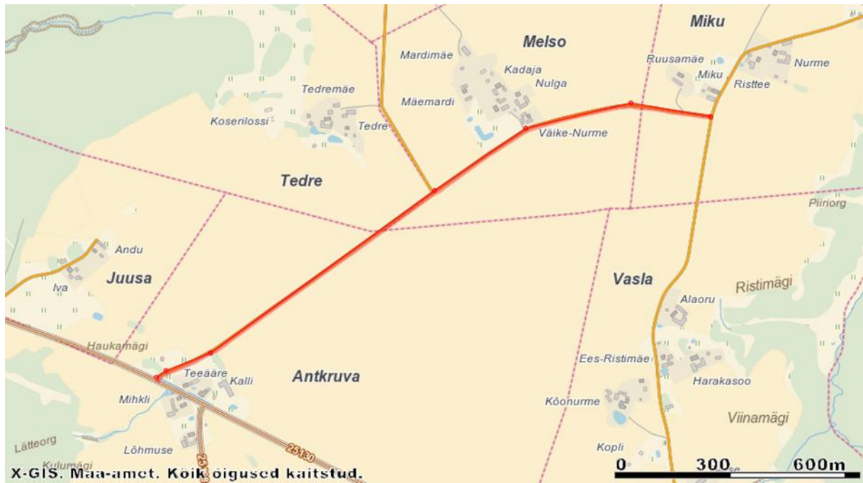
Tee nr 4600188