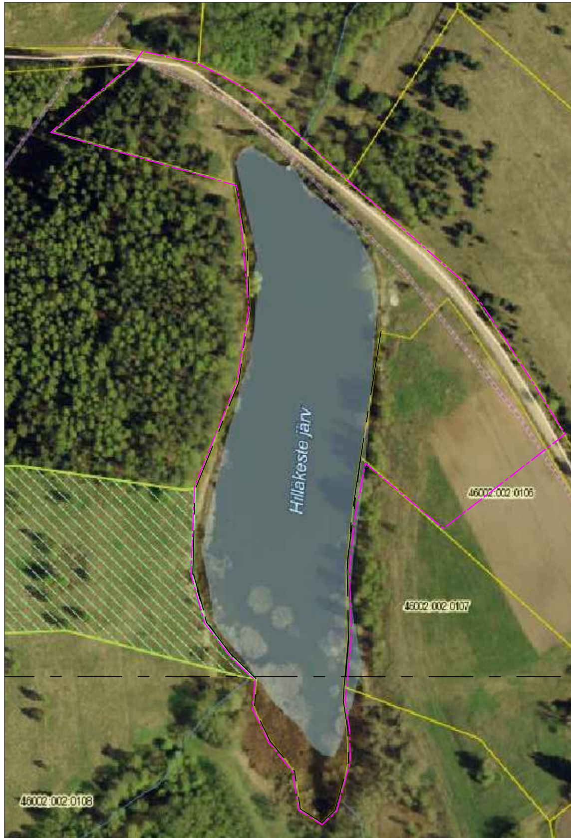
----- Detailplaneeringu piir